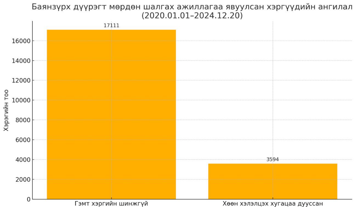
Зураг 2.3 Баянзүрх дүүрэгийн хэргэсгүй болсон хэрэг

Эх сурвалж: (Гэмт хэргийн хөөн хэлэлцэх хугацаа дууссан, 2020-2024)